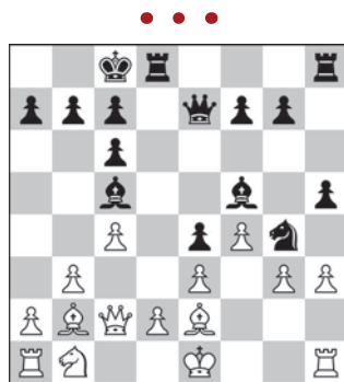
Bent Larsen – Boris Spasski Belgrad, 1970 r. Ruch czarnych

1... ♖h3!! Jedno z najbardziej niesamowitych posunięć w historii szachów. 2. g×h3 ♗f5 Za cenę figury Szirow otrzymuje bardzo aktywnego króla. 3. ♗f2 ♗e4 4. ♖×f6 (4. ♗e2 a3 5. ♖a1 d4 6. ♗d2 f5 7. ♗c2 f4 8. ♗d2 f3-+) 4... d4 Motyw przesłony. Gońiec teraz nie może kontrolować pola a1. 5. ♖e7 ♗d3 6. ♖c5 ♗c4 7. ♖e7 ♗b3 i czarne wygrały. Mogło jeszcze nastąpić: 8. ♗e2 ♗c2 9. ♖b4 d3+ 10. ♗e3 a3-+. (0-1).