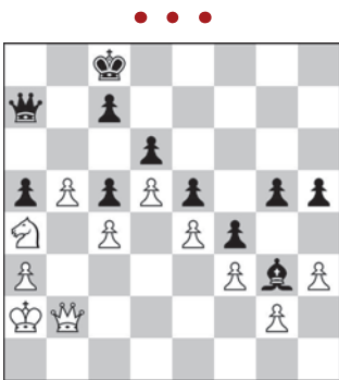
Arszak Petrosjan – Laszlo Hazai Schilde, 1970 r. Ruch czarnych

strzelają sobie „samobója”, pomagając dokończyć białym rozpoczęte dzieło. 10. ♖d7+ 1-0.