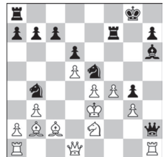
Lew Polugajewski – Raszid Neżmetdinow Soczi, 1958 r. Ruch czarnych

1... ♘g4 Skoczek zajmuje doskonałe miejsce do ataku. 2. ♖e4 (2. ♗×g4 ♖×d3 3. ♖ad1 ♖c×c3 4. ♖×c3 ♖×c3 z dużo lepszą pozycją) 2... ♗h4 3. g3 (3. h3 ♖×e4 4. ♗×g4 ♗×g4 5. h×g4 ♖×c3 6. ♖×c3 ♖d3 7. ♗h2 ♖×c3 8. ♖ac1 ♖c4 9. ♖fd1 ♖d5 z wygraną końcówką) 3... ♖×c3!! 4. g×h4 ♖d2!! 5. ♗×d2 ♖×e4+ 6. ♗g2 ♖h3! z groźbą ♖×h2#. Nieśmiertelna partia Akiwy Rubinsteina! (0-1).