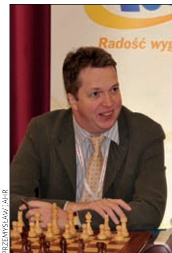
Nigel Short – wicemistrz świata PCA z 1993 r.

1.h5!! Kombinacyjny brylant, jakich Kasparow miał wiele w swojej karierze. 1...♖xf4 2.hxg6 ♙xd6 3.♖xh7+ ♙g8 4.gxf7+ ♙xh7 5.fxe8 ♙ Białe forsownie odbijają wieżę i promują pionka na hetmana. 5...♖xe6 6.♖f5+ ♙g7 7.♙g6+ ♙f8 8.♙xf6+ ♙e8 9.♖xe6 ♙f8?? Czarne od razu