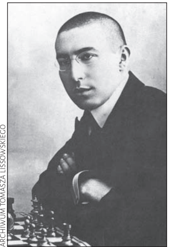
Wielki Akiwa Rubinstein (1880-1961)

później o jedno pole, dokonał zbitcia i jeszcze dotarł do pola promocji, bijąc wieżę z szachem (0-1).