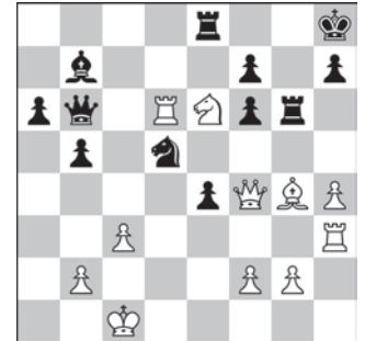
Garri Kasparow – Władimir Kramnik Nowogród, 1994 r. Ruch białych

13.♙d1 ♙b1+ Czarne wygrywają którąś z wież i... całą partię (0-1).