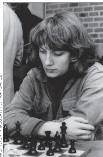
Młodziutki Jan Timman z Holandii pod koniec lat 60.