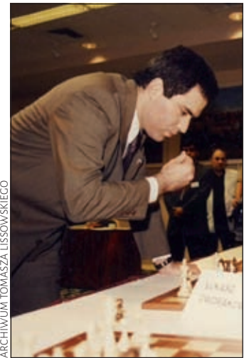
ARCHIWUM TOMASZA LISSOWSKIEGO

1...♖xf2!! 2.♖xf2 ♙a3! Niezwykła umiejętność dostrzeżenia gry po liniach pionowych i poziomych! 3.c3 ♙a2 4.b4 Groziło ♙a1+ i ♖xb2#. 4...♙a1+ 5.♙c2 ♙a4+ 6.♙b2 Czarne otwierają teraz linię do ataku dla wieży. 6.♙c1 dawało o wiele większe szanse na ratunek, choć pozycja białych mimo wszystko wisiałaby na włosku. 6...♖xb4 7.cxb4 ♖xb4+ 8.♙xb4 ♙xb4+ 9.♙c2 e3! W celu wprowadzenia do ataku gońca z c8. 10.♖xe3 ♖f5+ 11.♖d3 ♙c4+ 12.♙d2 ♙a2+