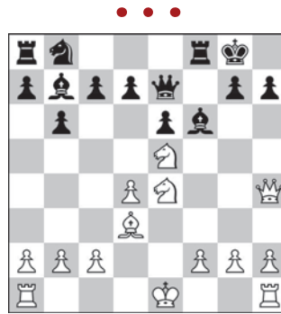
Edward Lasker – George Alan Thomas Londyn, 1911 r. Ruch białych

później o jedno pole, dokonał zbitcia i jeszcze dotarł do pola promocji, bijąc wieżę z szachem (0-1).