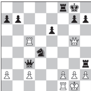
Stepan Lewitski – Frank Marshall Wrocław (Breslau), 1912 r. Ruch czarnych

Chciałbym zaprezentować 10 szokujących kombinacji pochodzących z partii turniejowych, które z pewnością były dla przeciwników gromami z jasnego nieba. W niektórych przypadkach będzie to pojedyncze posunięcie, innym razem wieloruchowa idea, której sens ujawnia się dopiero w późniejszej części partii. Z pewnością lista nie jest zamknięta, a szachowe piękno trudno jest porównywać, dlatego każdy z czytelników „Mata” może pokusić się o swoje własne zestawienie.