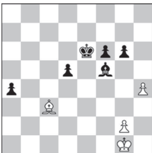
Weselin Topałow – Aleksiej Szirow Linares, 1998 r. Ruch czarnych

1... ♗b6!! Przepiękna idea blokad. 2. ♘xb6+ Jedyną szansą gry na wygraną było skupienie się na zdobyciu piona a5, np. przez: ♗d2, ♘b2, ♗b3 i ♗a4. 2... cxb6 3. h4 g×h4 4. ♗d2 h3 5. g×h3 h4 6. ♗b3 ♗b7 7. ♗a4 ♗a7 8. ♗g2 ♗b7 9. ♗b2 ♗a7 10. ♗c2 ♗b7 11. ♗c3 ♗a7 Białe nie są w stanie nic zrobić w tej pozycji, partia musi zakończyć się remisem (½-½).