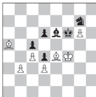
3. Ruch białych – mat w 1