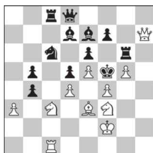
14. Ruch białych – mat w 1