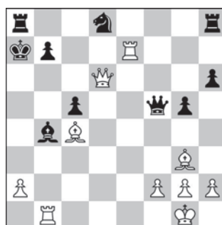
7. Ruch białych – mat w 1