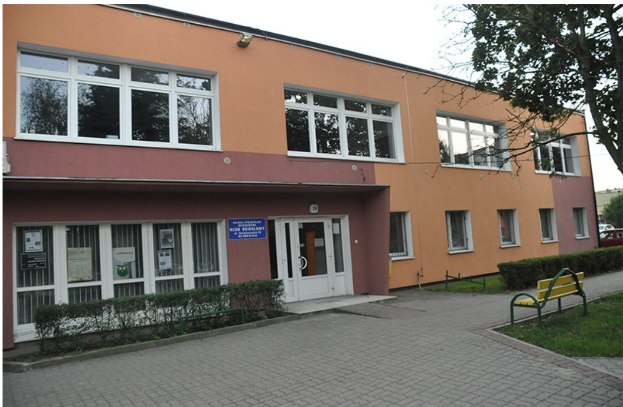
Klub KSM, ul. Serbinowska 25 w Kaliszu