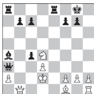
13. Ruch czarnych – mat w 1